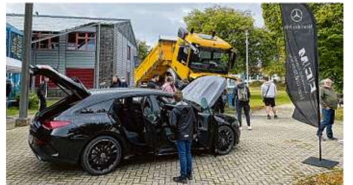
Schauen, informieren, Kontakte knüpfen - die Startzeit am OSZ Palmnicken kam gut an.